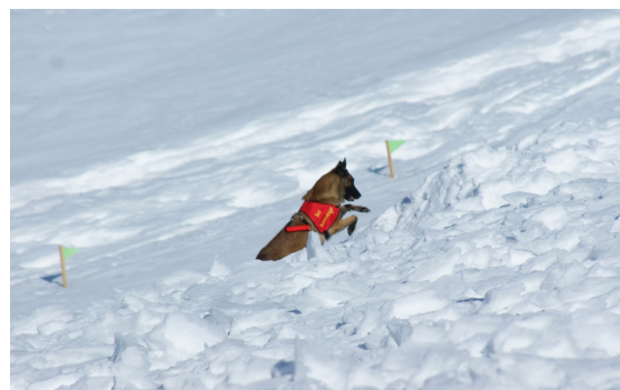
Sorro du clos champcheny, découverte de la victime en moins de 28 secondes

La première partie de la compétition, obéissance et dextérité, c'est déroulée sur le stade de la commune de Villarlurin où les concurrents ont accompli les exercices du programme avec plus ou moins de réussite. Certains exercices comme le diriger a distance a demandé énormément de travail a nos conducteurs et a fortement impressionné le public.